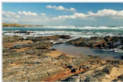
TASMANIA ARTHUR RIVER COAST